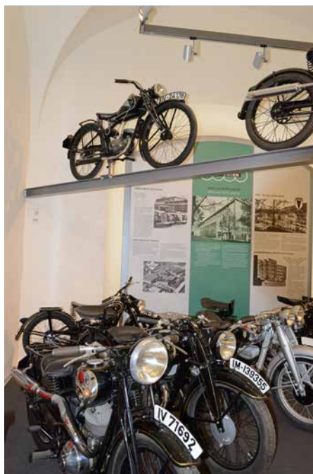
1988 posierte Romy Nietzsche (Foto r.) auf einer MZ für ein Plakat für die erste Mokick-Rallye der Freien Deutschen Jugend im Kreis Stendal. Heute steht die MZ im Motorradmuseum auf Schloss Augustusburg (Foto l.)

Mein Vater, der eine Woche vor dieser Entscheidung 100 Jahre alt geworden wäre, meine Mutter und meine Schwester, die auf dem Städtischen Friedhof begraben sind, würden sich sicher freuen, dass ihre Heimatstadt, in der sie so viel Bitteres, aber auch Schönes und sich Entwickelndes erlebten, so geehrt wird.