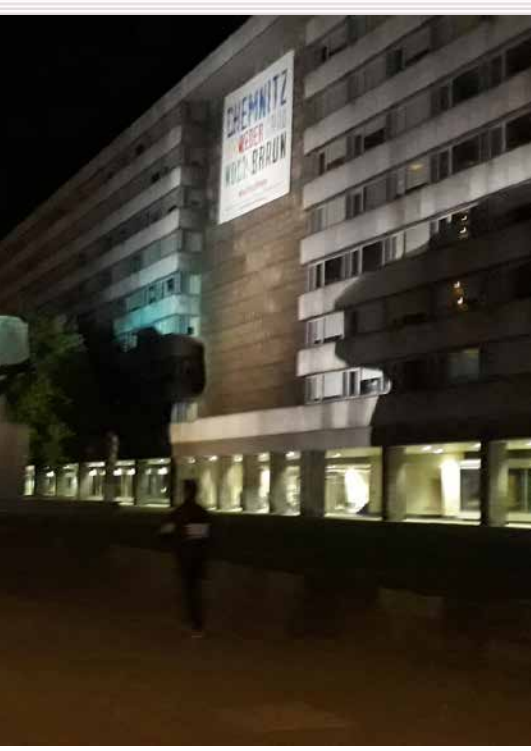
den die drittgrößte Stadt im Freistaat Sachsen.

1953 – Stalin war gerade gestorben, ich ging noch nicht zur Schule, es gab noch regelmäßig Stromabschaltungen in der Stadt – erhielt das „sächsische Manchester“, auch „Ruß-Caamtz“ genannt den Namen „Karl-Marx-Stadt“, den Otto Grotewohl ihr auf dem Stalinplatz verlieh. Gewürdigt werden sollte so vom sozialistischen deutschen Staat die rühmliche Tradition der Stadt, in der Lokomotiven und PKW, Werkzeug- und Textilmaschinen von Weltgeltung sowie Textilien hergestellt wurden, in der der Hände Arbeit des Proletariats in der Zeit der Industrialisierung und ihr politischer Kampf die Stadt wachsen und aufblühen ließ. Eine mehr und mehr sozialistische Stadt sollte sich entwickeln. Niemand wurde gefragt, ob die Bürger der Stadt dies auch so wollten. Es ahnte aber auch noch niemand, dass 1990 sich die Einwohner dann frei entscheiden konnten, diesen Namen wieder abzulegen.