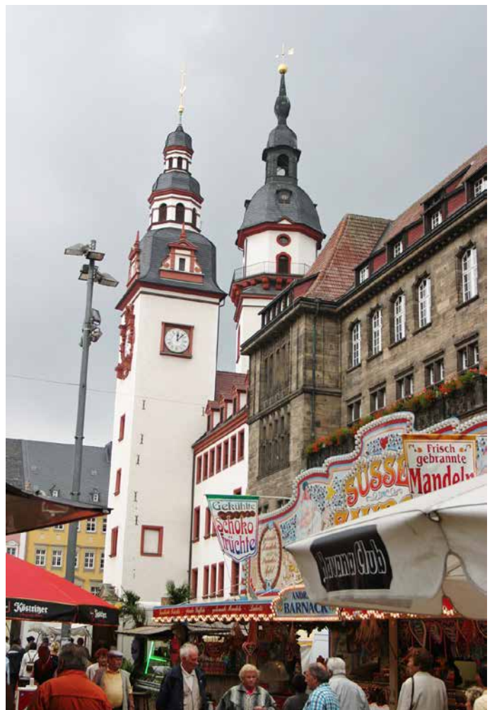
Solch einen Weihnachtstrubel wie früher wird es in diesem Jahr in Chemnitz nicht geben.

Das Zentrum meiner Heimatstadt kenne ich eigentlich von Anfang an nur als eine große Brache. Nach den Kriegszerstörungen standen im Zentrum der Stadt nur noch wenige Gebäude: Das Rathaus und der Rote Turm, die Ruine des Kaufhaus Tietz und die Ruine des Opernhauses, die Dresdner Bank, das Kaufhaus Scho-