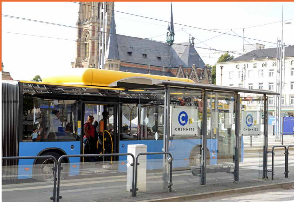
Seit Mitte September wird im öffentlichen Nahverkehr in Chemnitz die Einhaltung der Masken-Tragepflicht kontrolliert.

den Neubau der Straßenbahn, die neuen Kunstwerke und Brunnen in der Stadt. Vieles blieb damals leider unvollendet. Zusammen mit den verschiedenen Bauten aus der Bauhauszeit nennt sich Chemnitz heute nicht unbegründet Stadt der Moderne. Vom alten bürgerlich-proletarischen Chemnitz war in jener Zeit nicht mehr viel zu sehen. Nur von alten Fotos und Dias bei Foto Kratzsch am Markt kenne ich die Stadt meiner Eltern: Das Alte Schauspielhaus, die Königstraße, den Markt, die Pauli-Kirche, deren Ruine am Rosenhof gesprengt wurde. Vertraut waren mir die Gründerzeithäuser auf