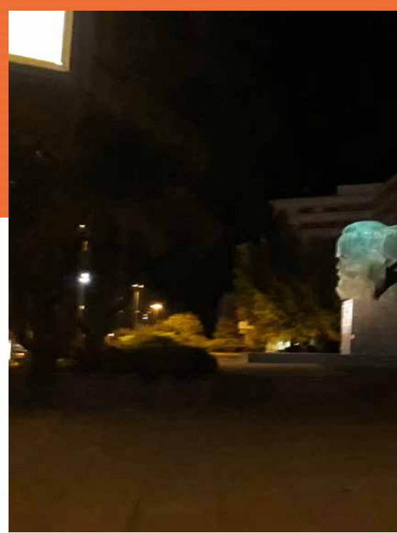
Chemnitz (von 1953 bis 1990 Karl-Marx-Stadt) ist nach Leipzig und Dres

Unsere Wohnverhältnisse verbesserten sich ab 1949 nach Gründung der DDR nur wenig. 36 Jahre lebte unsere Familie in einer Eineinhalb-Zimmer-Wohnung für 24,99 Mark Miete mit Ofenheizung und Plumpsklo, dessen Sammelgrube einmal im Monat mittels Rohrleitung quer durch das Haus geleert wurde. Kohlen und Kartoffeln aus dem Keller holen war Alltag, wofür wir jedes Jahr im Herbst die von Jungnickel aus der Hainstraße mit Handwagen geholte Braunkohle und Briketts sowie säckeweise Kartoffeln einkellerten. Bis 1958